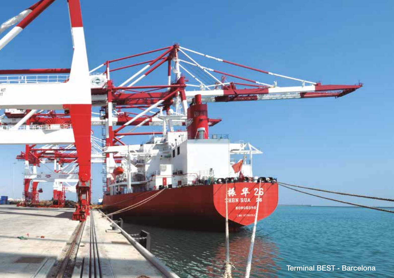
Terminal BEST - Barcelona